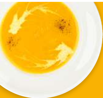
Крем-суп овощной с семгой

Дорогие гости, если у вас есть аллергия на какой-либо продукт, пожалуйста, сообщите об этом официанту