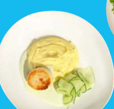
Куриная котлета с картофельным пюре и свежим огурцом