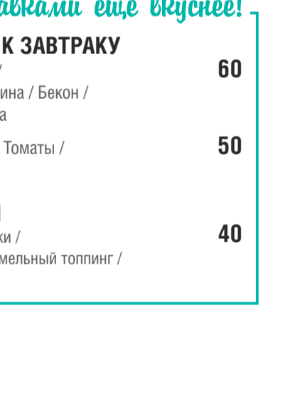
Гречневая каша с пастроми