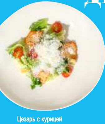
Цезарь с курицей