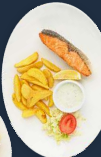
Семга на гриле с запеченным картофелем