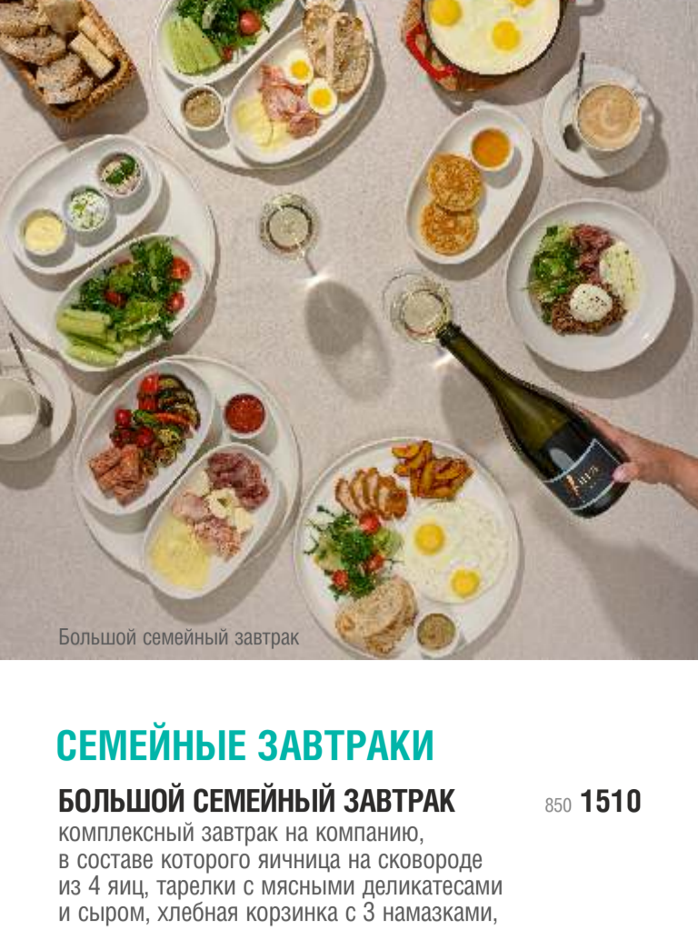
Большой семейный завтрак