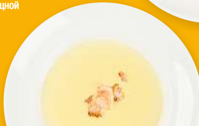
Сырный суп с тигровыми креветками