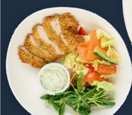
Куриное филе в панировке с пикантным салатом