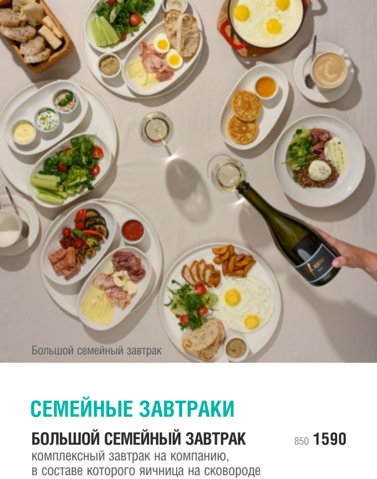
Большой семейный завтрак