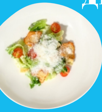
Цезарь с курицей