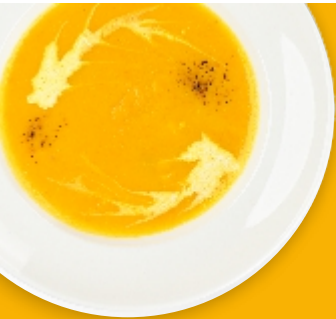
Крем-суп овощной с семгой

Дорогие гости, если у вас есть аллергия на какой-либо продукт, пожалуйста, сообщите об этом официанту