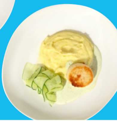
Куриная котлета с картофельным пюре и свежим огурцом