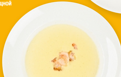
Сырный суп с тигровыми креветками