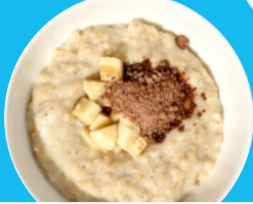
Овсяная каша с шоколадом и бананом на молоке