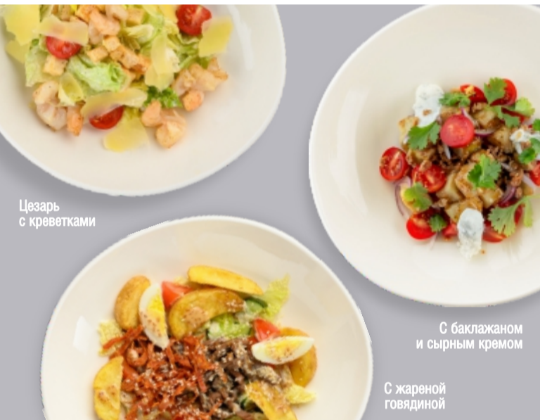
Цезарь с креветками

хрустящие баклажаны, помидоры черри, сладкие томаты, хрустящий лук, сырный крем со сладко-пряной заправкой и соусом песто