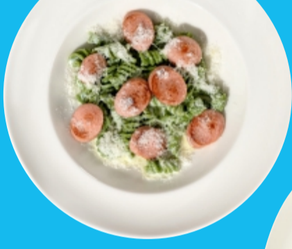
Зеленые макароны с сосисками